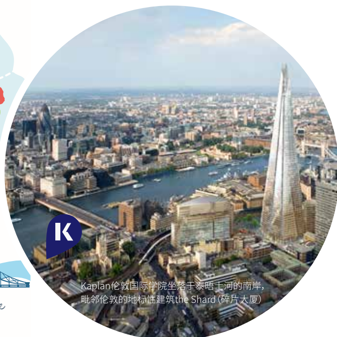
Kaplan伦敦国际学院坐落于泰晤士河的南岸，毗邻伦敦的地标性建筑the Shard(碎片大厦)