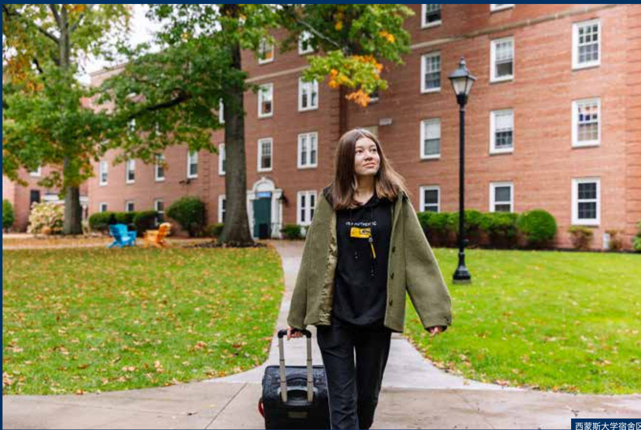
西蒙斯大学宿舍区