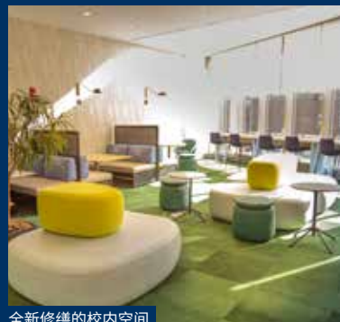
全新修缮的校内空间