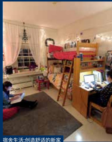
宿舍生活:创造舒适的新家