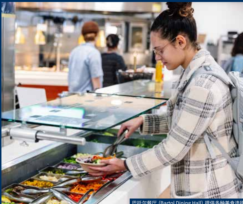
巴托尔餐厅 (Bartol Dining Hall) 提供多种美食选择